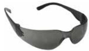
Schutzbrille EXPERIENCE EN166 getönt L-D86997